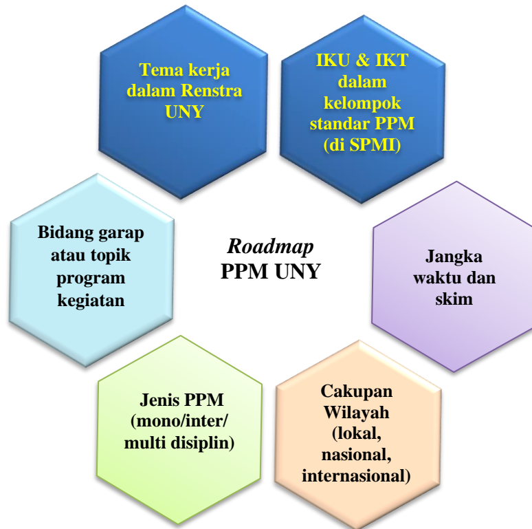
Gambar 2. Komponen-komponen dalam Proses Penyusunan Roadmap PPM

Selanjutnya berdasarkan keenam komponen di atas dapat dikembangkan dan disusun peta jalan (roadmap) program Pengabdian kepada Masyarakat UNY selama 5 (lima) tahun ke depan. Peta jalan tersebut pada intinya adalah milestone kondisi yang diinginkan (atau target) dari seluruh kegiatan PPM UNY setiap tahun hingga 5 tahun kedepan. Untuk memudahkan pembacaan dan pemahaman peta jalan PPM 5 tahun ke depan, dibuat, dan disajikan dalam Tabel 1.