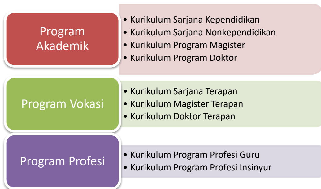
Gambar 2. Model Kurikulum UNY

Kurikulum Universitas Negeri Yogyakarta terdiri dari program akademik, program vokasi, dan program profesi. Model kurikulum dijelaskan pada Gambar 2.